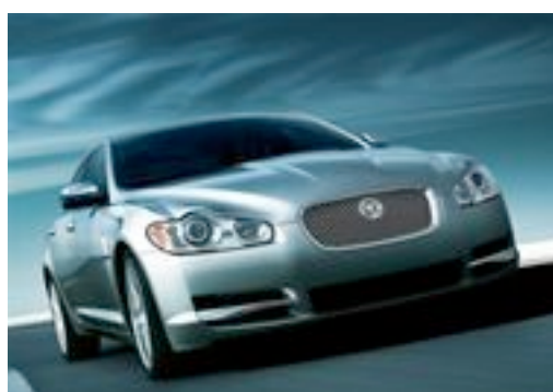
Jaguar XF, der på torsdag mister dieselmotoren til fordel for en lydløs elmotor

Den 1-2 august, under Copenhagen Historic Grand Prix, vil de professionelle racerkørere køre et ræs i de allernyeste og allerhurtigste elbiler, eksempelvis Teslaen der accelererer fra 0-100 på under fire sekunder. Der er tale om et racerløb godkendt af DASU – Dansk Automobil Sports Union.