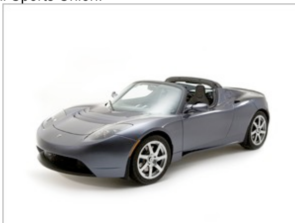
Tesla som bliver en af de elbiler der vil konkurrere i Københavns gader

Den 1-2 august, under Copenhagen Historic Grand Prix, vil de professionelle racerkørere køre et ræs i de allernyeste og allerhurtigste elbiler, eksempelvis Teslaen der accelererer fra 0-100 på under fire sekunder. Der er tale om et racerløb godkendt af DASU – Dansk Automobil Sports Union.